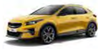
Quantum Yellow (YQM)