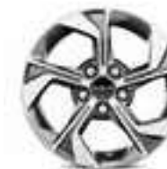
16" lichtmetalen velg