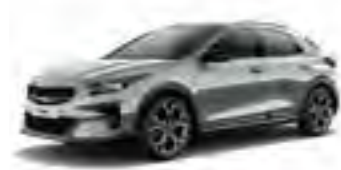
Lunar Silver (CCS)