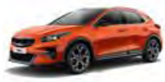
Orange Fusion (RNG)