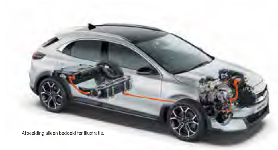
Afbeelding alleen bedoeld ter illustratie.

Nieuw in de Kia XCeed familie is ook het EcoDynamics+ Mild Hybrid Powertrain System. Daarmee kun je uitzonderlijk zuinig rijden zonder opladen, en met minimale emissies. De brandstofmotor is is daarbij gekoppeld aan een 48-volt lithium-ion accu en een compacte elektromotor. Die laatste ondersteunt de brandstofmotor bij acceleratie en wint remenergie terug als stroom voor de accu. Dat rijdt heel dynamisch én superzuinig!