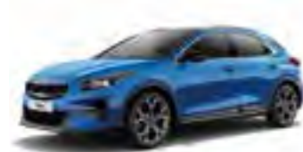
Blue Flame (B3L)