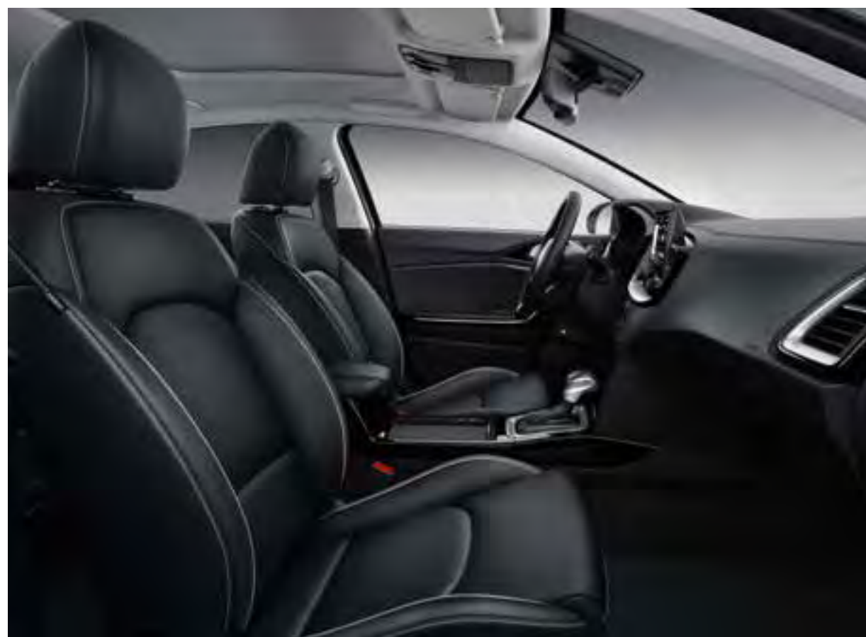
Interieur in zwart leder (ExecutiveLine). Zachte gevoerde stoelen in zwart leder bieden exclusief comfort; een perfecte match met de hoogglans zwarte afwerking en satijnchromen accenten in het dashboard.