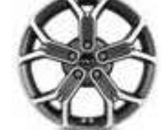
18" lichtmetalen velg