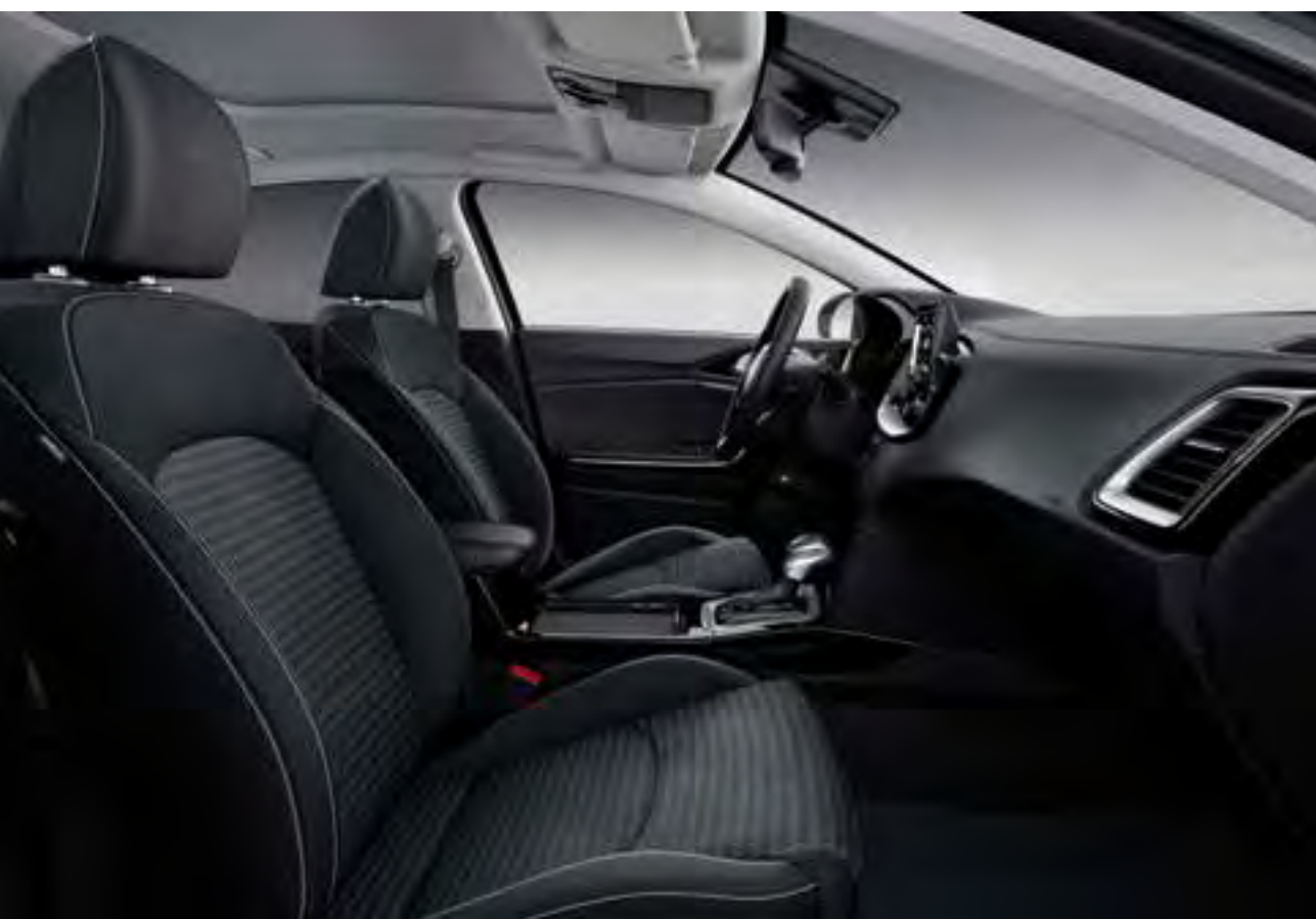
Standaard interieur zwart (ComfortLine). Standaard zwart interieur met stoffen bekleding en stijlvolle satijnchromen details.