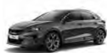
Penta Metal (H8G)