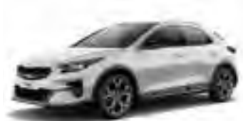
Deluxe White Pearl (HW2)