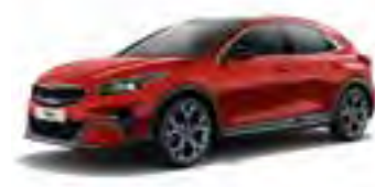
Infra Red (AA9)