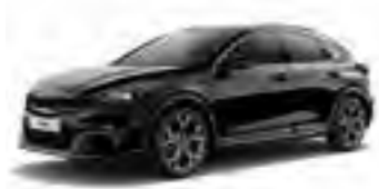
Black Pearl (1K)