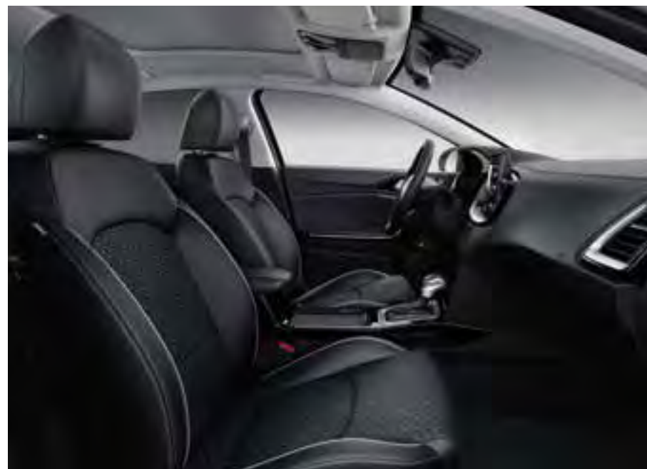
Zwart stof/lederlook combinatie (DynamicLine / DynamicPlusLine). Stijlvol zwart interieur, uitgevoerd in een hoogwaardige stof/kunstleder-combinatie, inclusief hoogglans zwarte afwerking met satijnchromen accenten in het dashboard.

In het interieur biedt de XCeed keuze uit diverse soorten bekleding en bijzondere accenten. Stuk voor stuk uitgevoerd in topklasse materiaal. En al zeggen we 't zelf: dat ziet er héél uitnodigend uit! Zoals de zwarte bekleding in stof/kunstleder, voor een elegante touch. Maak jij graag een gedurfd statement, dan is er het colour pack Quantum Yellow met contrasterende stiksels, uitdagende gele accenten in het dashboard en een fijn honingraatmotief in de stoelbekleding. Of, als top of the bill, het volledig lederen interieur in stijlvol zwart.