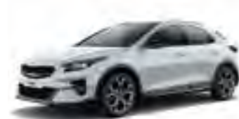
Cassa White (WD)