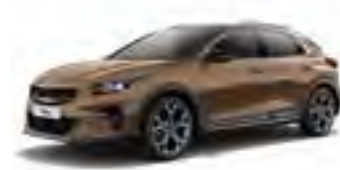
Machined Bronze (M6Y)