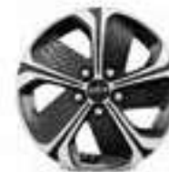
16" lichtmetalen velg (alleen voor PHEV)