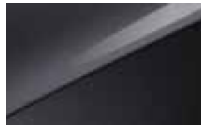
Penta Metal (H8G)