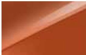
Orange Fusion (RNG) Alleen voor GT-(Plus)Line en GT