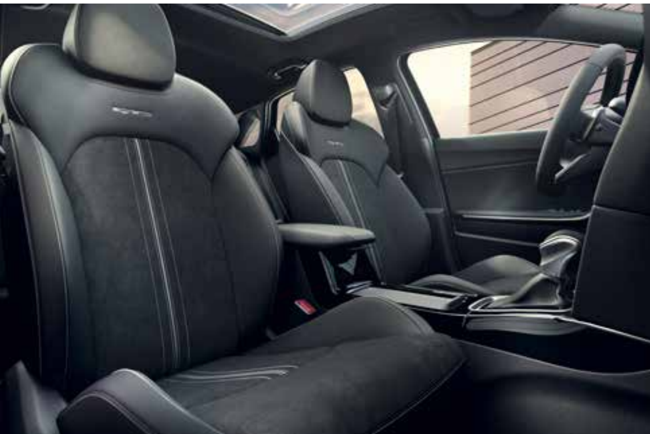
GT-Line interieur zwart suède/leder. Smaakvolle combinatie van zwart suède en leer met contrasterende grijze stiksels en GT-Line logo; hemelbekleding in zwart. (dit interieur type is ook standaard voor de GT-PlusLine uitvoering)