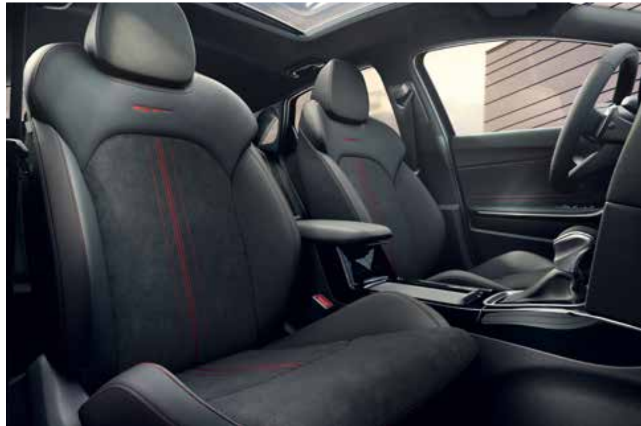
GT. Topklasse interieur met sportieve kuipstoelen uitgevoerd in hoogwaardig zwart suède/leder-combinatie met sportieve rode stiksels en GT-logo; hemelbekleding in zwart.