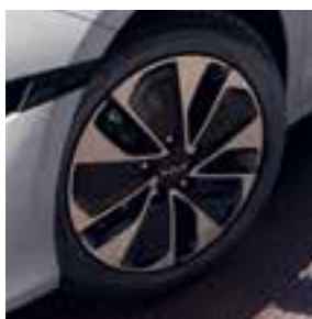
16" lichtmetaal (PHEV)