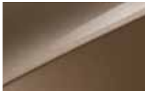
Machined Bronze (M6Y) Niet voor GT-(Plus)Line en GT