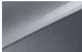
Lunar Silver (CSS)