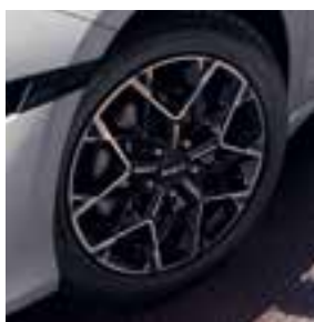
GT-(Plus)Line 17" lichtmetaal met diamantgeslepen afwerking (two-tone).