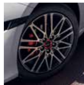
GT 18" lichtmetaal