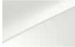
Casa White (WD) Niet voor GT

Kleur je wereld met creativiteit. De nieuwe Ceed biedt keuze uit 13 sprankelende carrosseriekleuren én 6 unieke velgdesigns. Zeg het maar: welke vind jij het mooist?