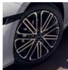
GT-PlusLine 18" lichtmetaal (alleen voor DCT7-automaat)