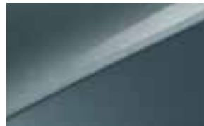
Yucca Steel Grey (USG) Niet voor GT-(Plus)Line en GT