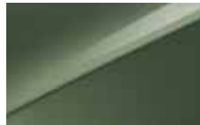
Experience Green (EXG)