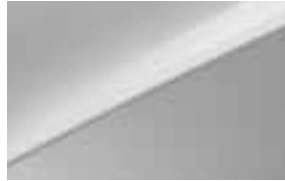
Silky Silver (4SS) Niet voor PHEV, GT en GT-(Plus)Line