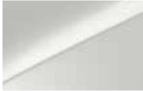
Deluxe White (HW2)