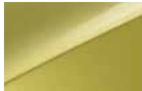
Splash Lemon (G2Y) Niet voor GT-(Plus)Line en GT