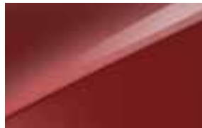
Infra Red (AA9)